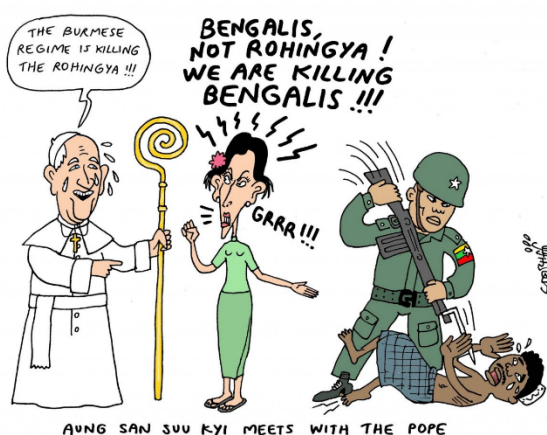
Source: The Nation 5 May 2017 スーチー国家顧問とロヒンギャ問題